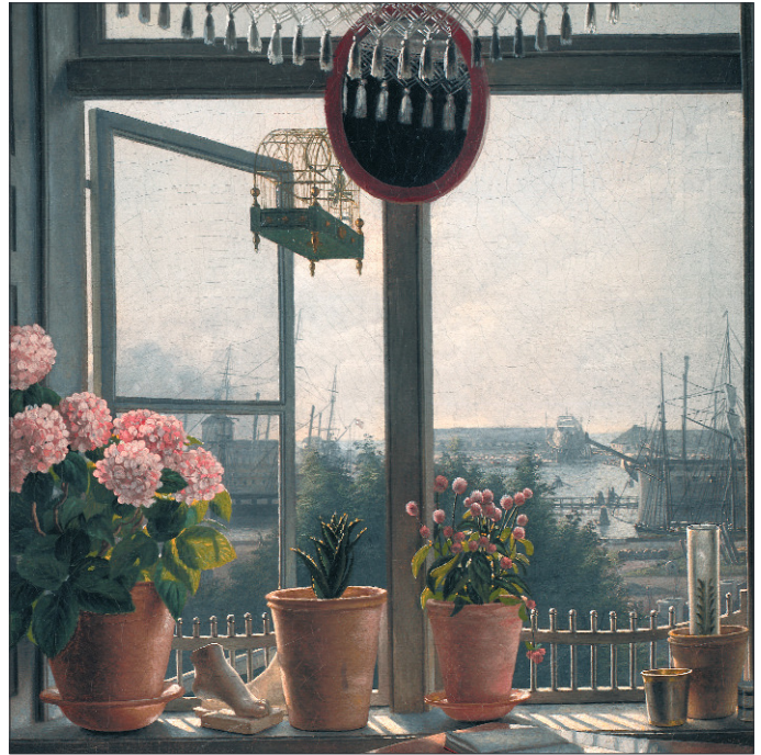
Martinus Rørbye (1803-48), "Udsigt fra kunstnerens vindue", ca. 1825. Fra kunstnerens vindue ser vi ud på skibene i havnen. Skibet som kan bringe mennesker til fjerne eksotiske lande og nye oplevelser, viden og varer tilbage til Danmark.

3: Et tredje og overlappende tema er den teknologi og de transportmidler, såsom tog og dampskib, som er i rivende vækst i 1847, og som muliggør