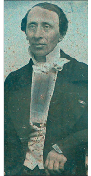
Fotografiet herover af H. C. Andersen er blot et af mange. Andersen var meget selvbevidst og stillede sig gerne i positur foran kameraet. Han var dog ikke altid tilfreds med resultatet.